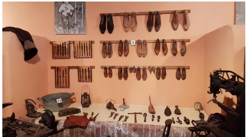
Gli strumenti del calzolaio