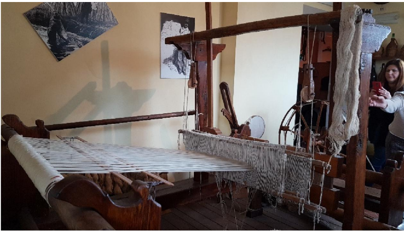
Il telaio per la canapa