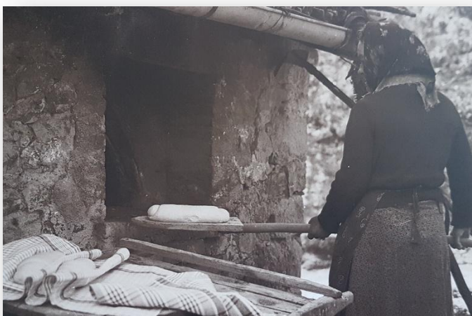
La cottura del pane e della polenta

All’interno sono presenti anche numerose foto storiche che testimoniano alcuni dei più antichi mestieri.