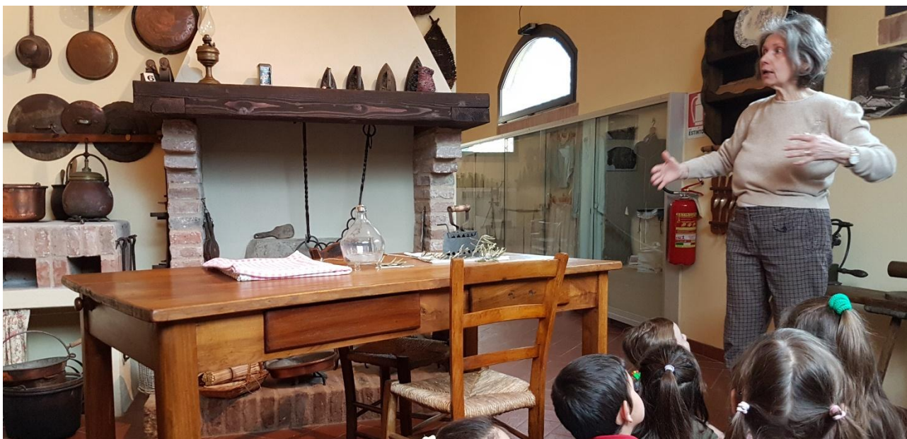
La cucina della casa contadina

Per avere una visione più completa della civiltà contadina in cui hanno vissuto i loro nonni, il 4 aprile hanno visitato il Museo di Arti e Mestieri di Pianoro , un museo della cultura materiale relativa al vissuto del nostro Appennino, dove hanno potuto vedere ricostruite le varie stanze della casa contadina e vari strumenti utilizzati nel passato, tra cui appunto anche la stadera. Il Museo di Arti e Mestieri studia e raccoglie le testimonianze materiali della passata civiltà contadina e artigianale del territorio delle vallate (Savena, Idice, Setta).