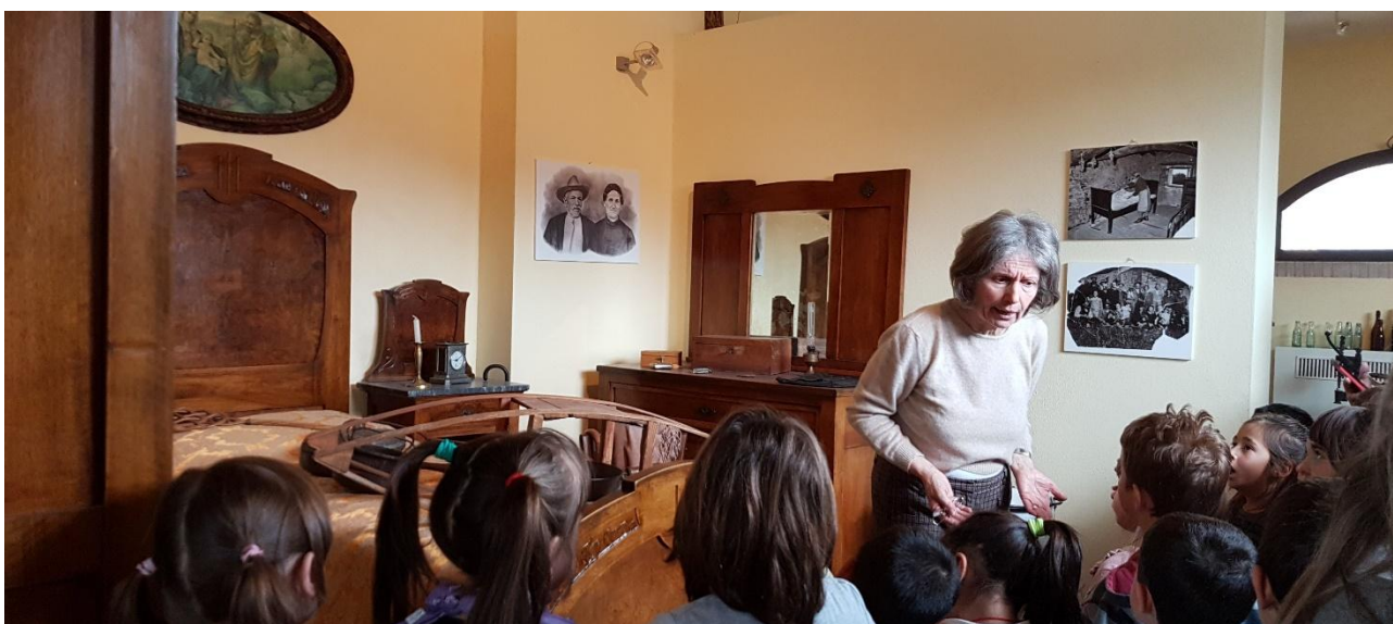
La camera da letto della casa contadina