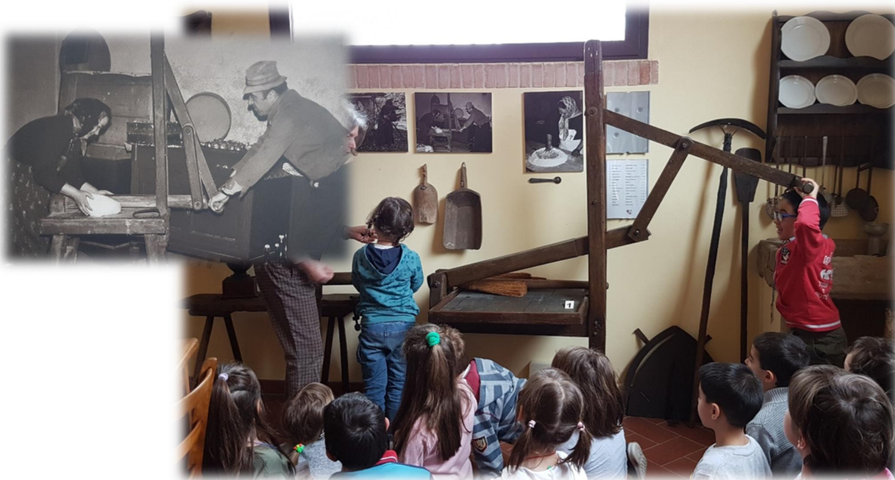
Due bambini della classe prima fanno l’Azdora” e l’Azdor” che preparano il pane.

La guida ha spiegato loro come la famiglia contadina fosse una sorta di famiglia “allargata” rispetto ai giorni nostri e nella stessa casa vivono insieme la coppia più anziana, l’Azdora” e l’Azdor”, che gestivano la vita familiare (la donna in casa e l’uomo nei campi), tutti i loro figli maschi con le spose e i figli e le figlie femmine non sposate. I bambini hanno potuto anche provare ad utilizzare alcuni antichi strumenti.